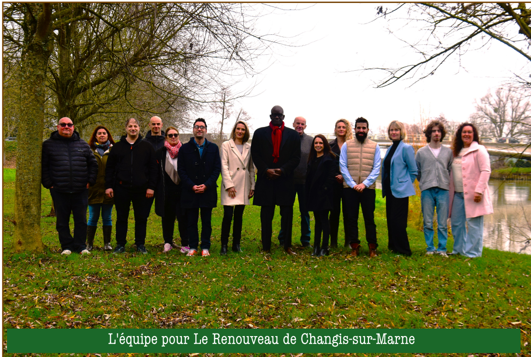
L'équipe pour Le Renouveau de Changis-sur-Marne